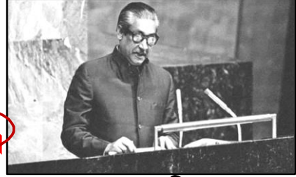
বঙ্গবন্ধু শেখ মুজিবুর রহমান- জাতিসংঘে ভাষণ (২৯ তম) অধিবেশনে

❑ জাতিসংঘ PBC এর প্রথম নারী সভাপতি হলো রাবাব ফাতিমা।