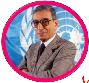
বুট্রোস বুট্রোস ঘালি