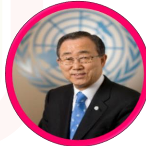
বান কি মুন