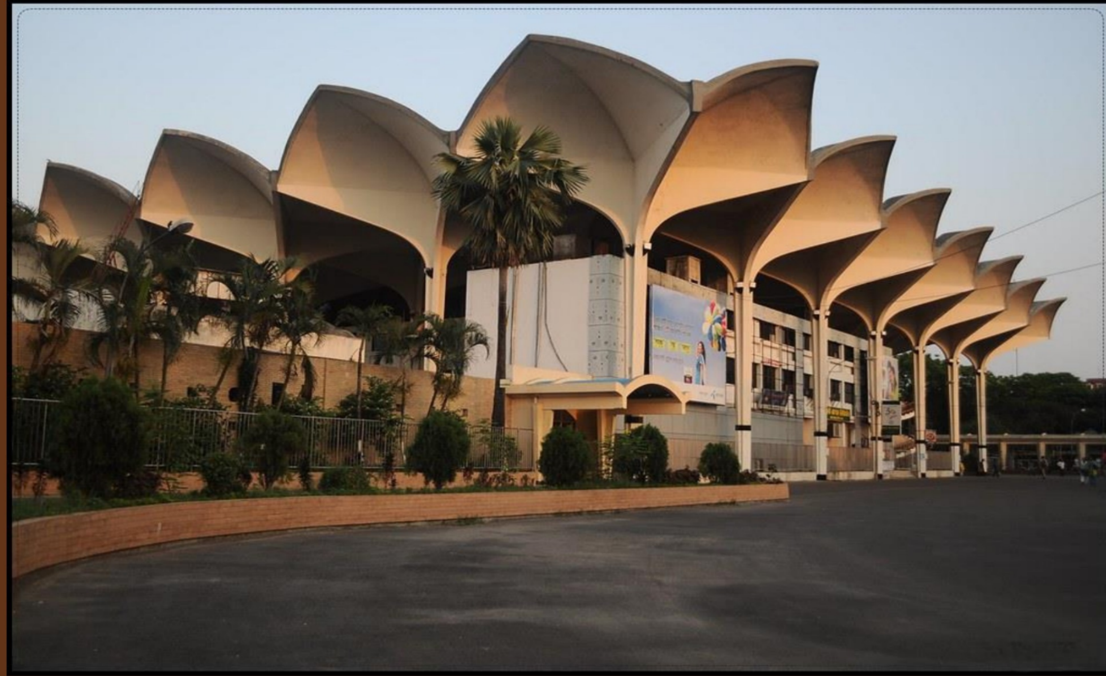
কমলাপুর রেলওয়ে ষ্টেশন