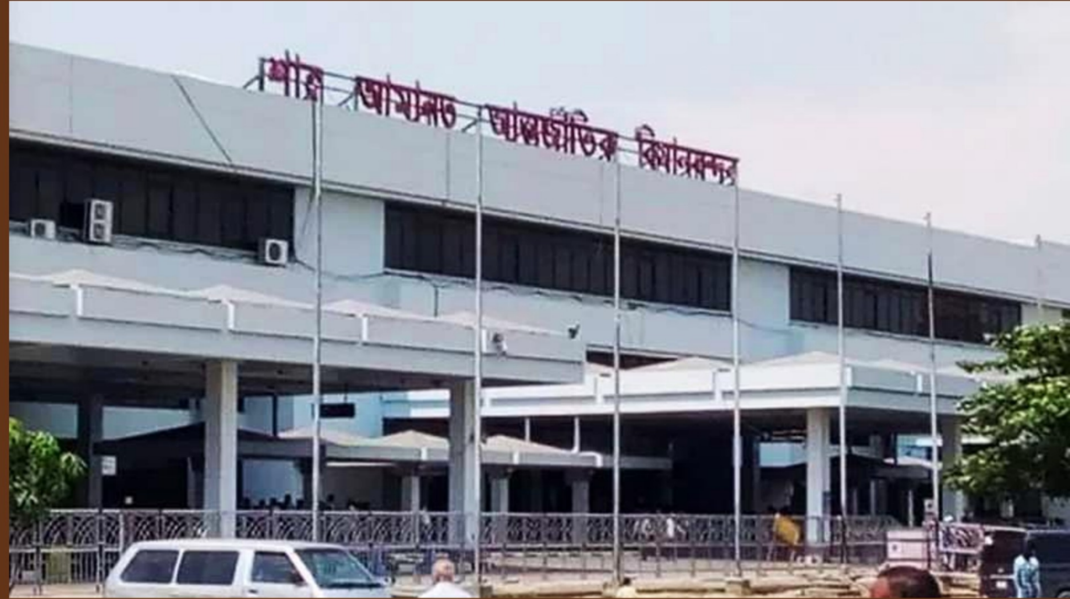
শাহ আমানত আন্তর্জাতিক বিমানবন্দর