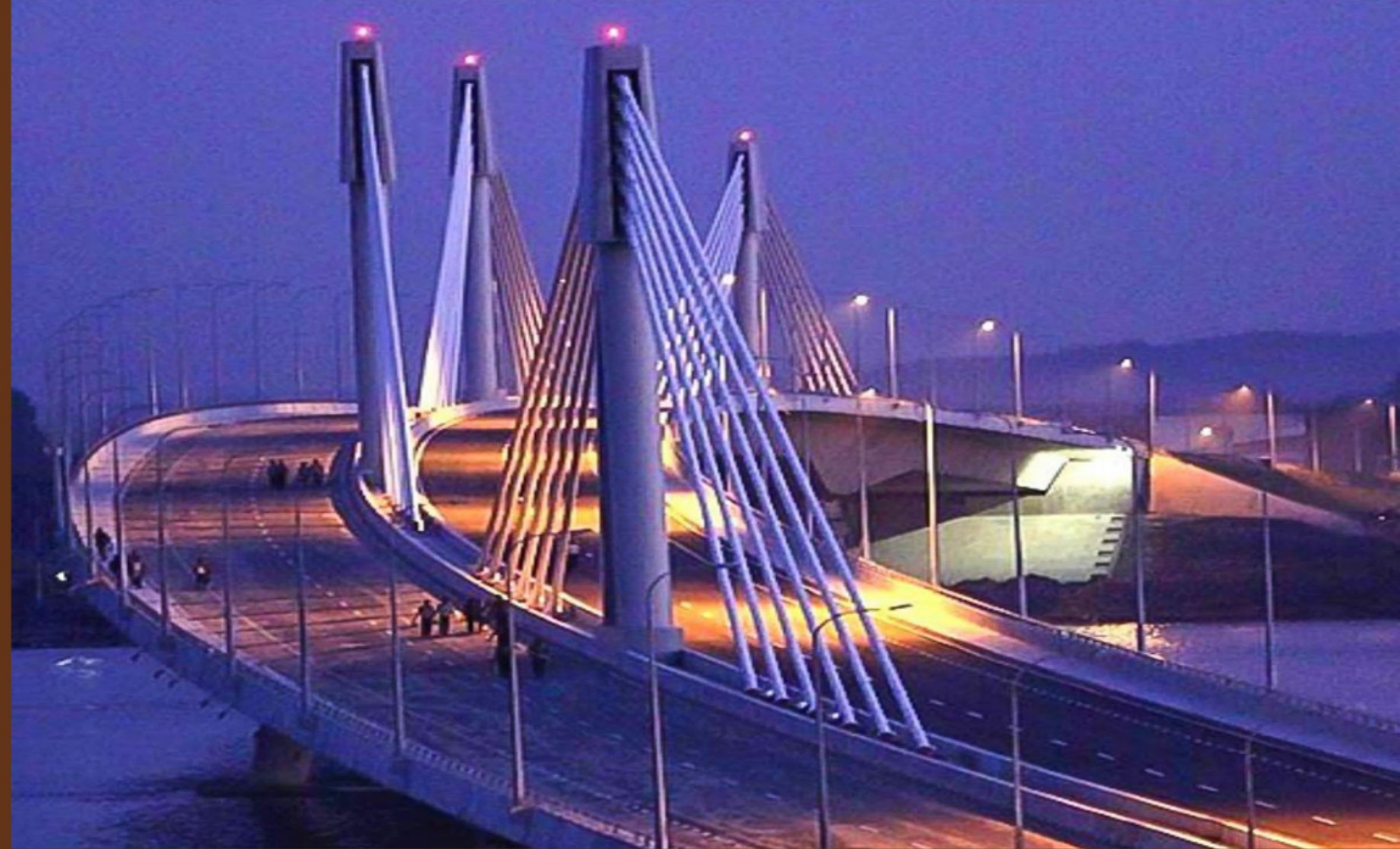
শাহ আমানত সেতু