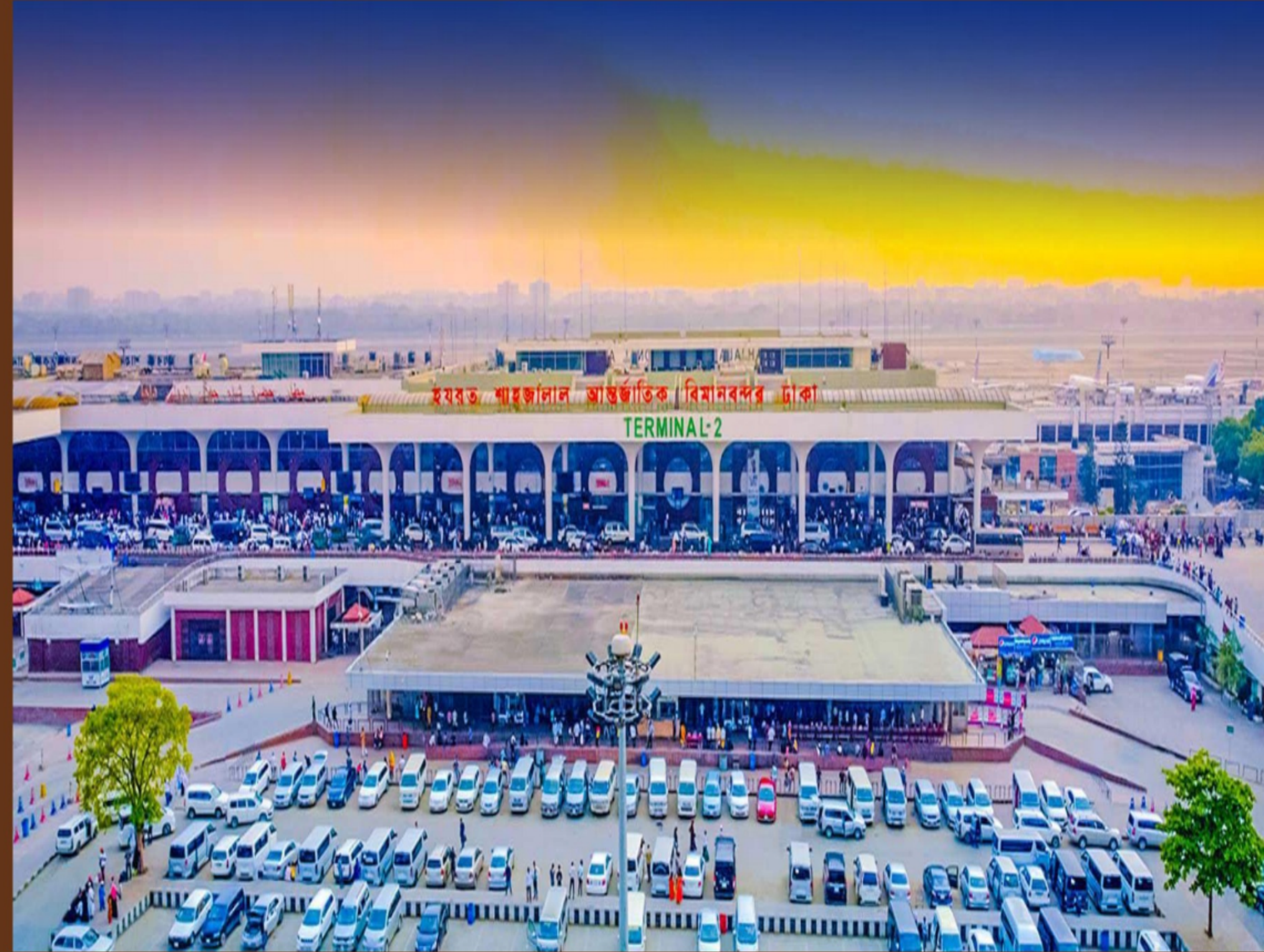
হযরত শাহজালাল (রহ.) আন্তর্জাতিক বিমানবন্দর