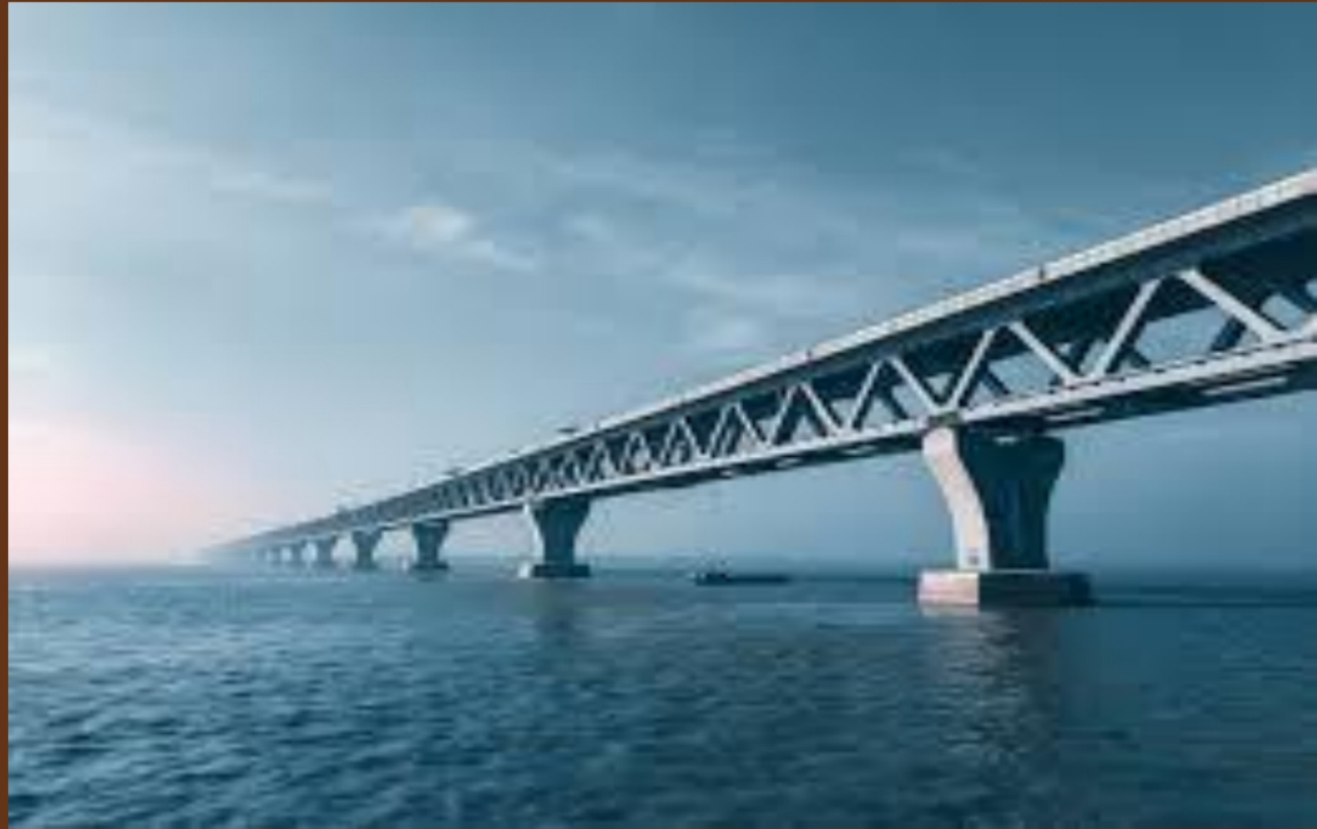
পদ্মা সেতু (দৈর্ঘ্য- ৬.১৫ কি.মি)