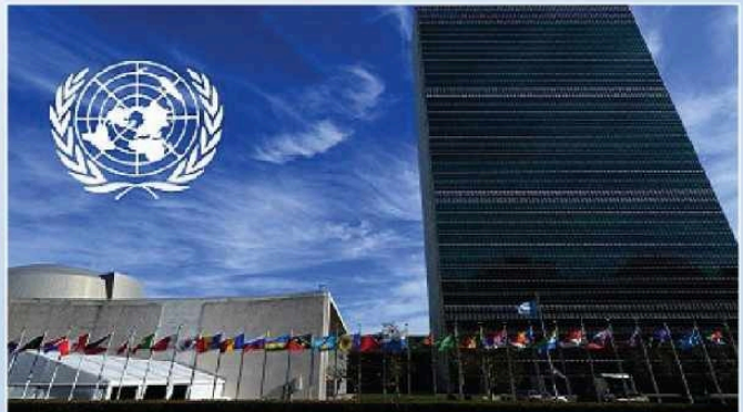
জাতিসংঘ ভবন, নিউইয়র্ক