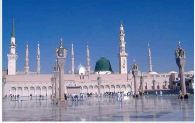
পবিত্র মসজিদে নববী, মদিনা শরীফ