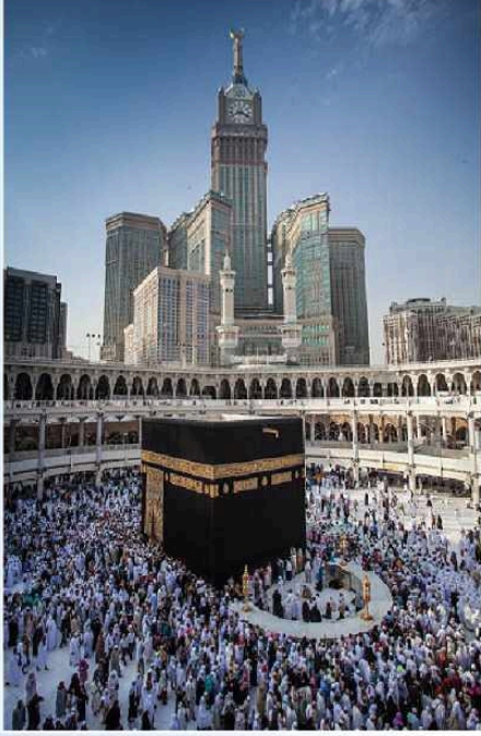
পবিত্র মক্কা শরীফ