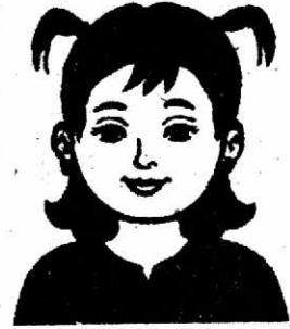
Sister (সিসটার) - বোন