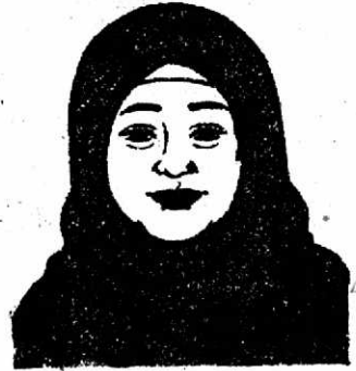
Mother (মাদার) - মা