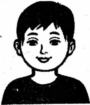
Brother (ব্রাদার) - ভাই