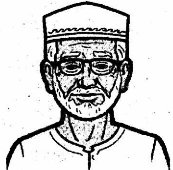
Grandfather (গ্রান্ডফাদার) - দাদা

Ans. They are family members. (দে আর ফ্যামিলি মেম্বারস।) - তারা পরিবারের সদস্য।