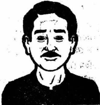
Father (ফাদার) - বাবু/আব্বা