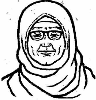
Grandmother (গ্রান্ডমাদার) - দাদিমা

A Look at the pictures. Who are they? (লুক অ্যাট দা পিকচারস। হু আর দে?) - ছবিটির দিকে তাকও। তারা কারা?