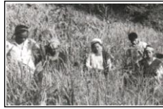
চিত্র - ২