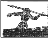
চিত্র - ১