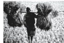
চিত্র - ২