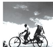
চিত্র - ১

নিচের চিত্র দুটি লব কর এবং প্রশ্নগুলোর উত্তর দাও :